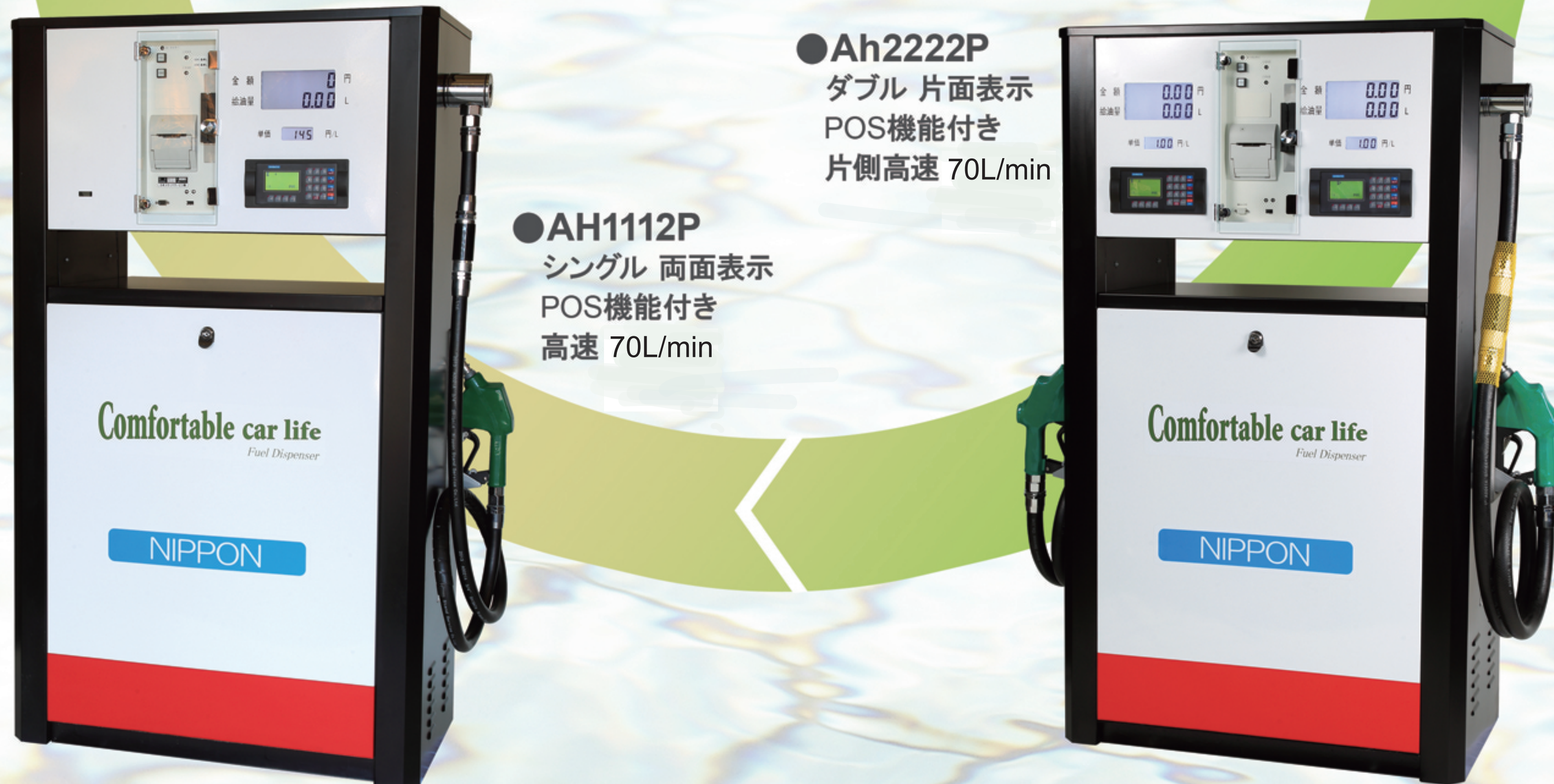
●Ah2222P ダブル 片面表示 POS機能付き 片側高速 70L/min