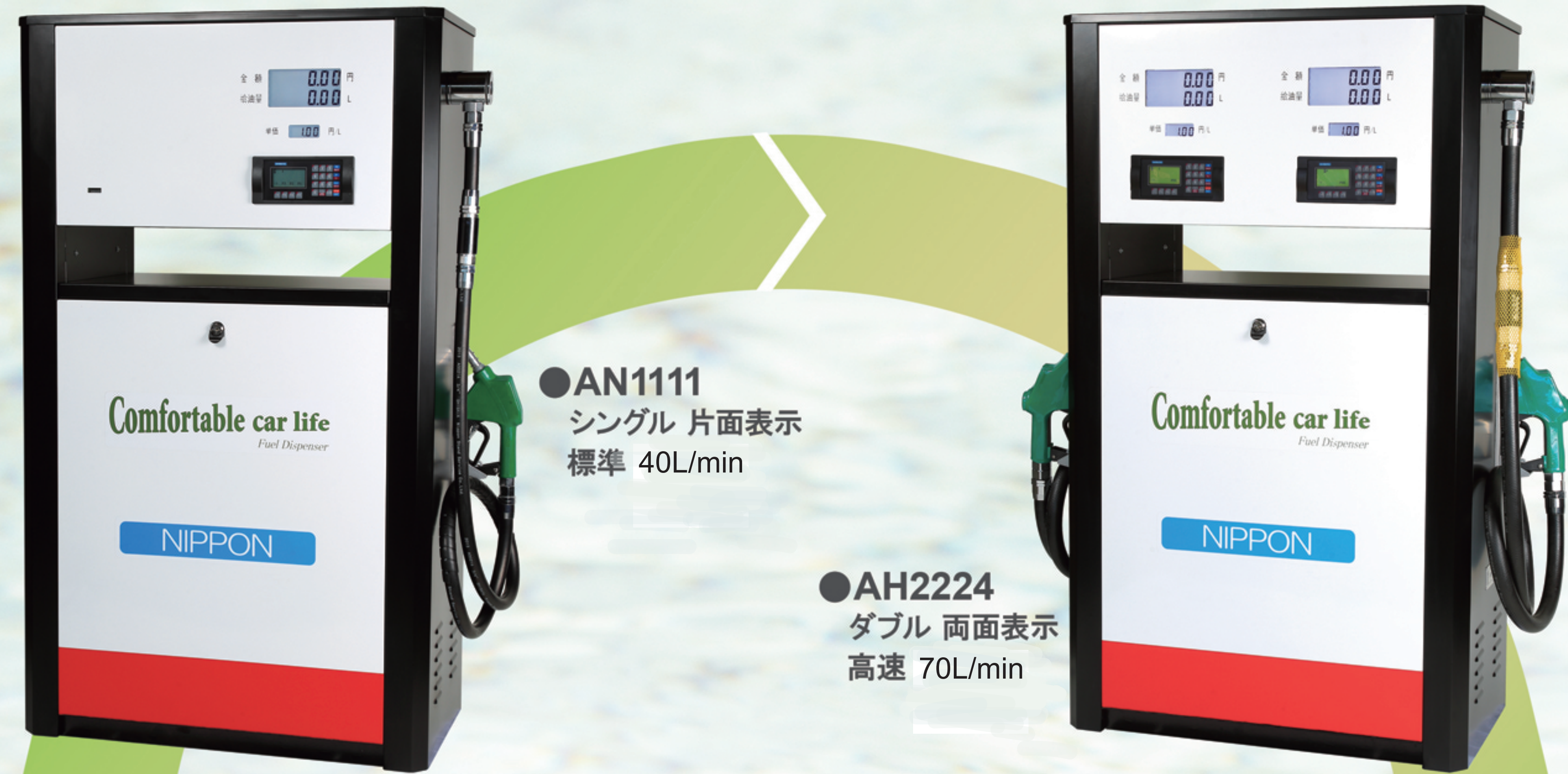
●AN1111 シングル 片面表示 標準 40L/min